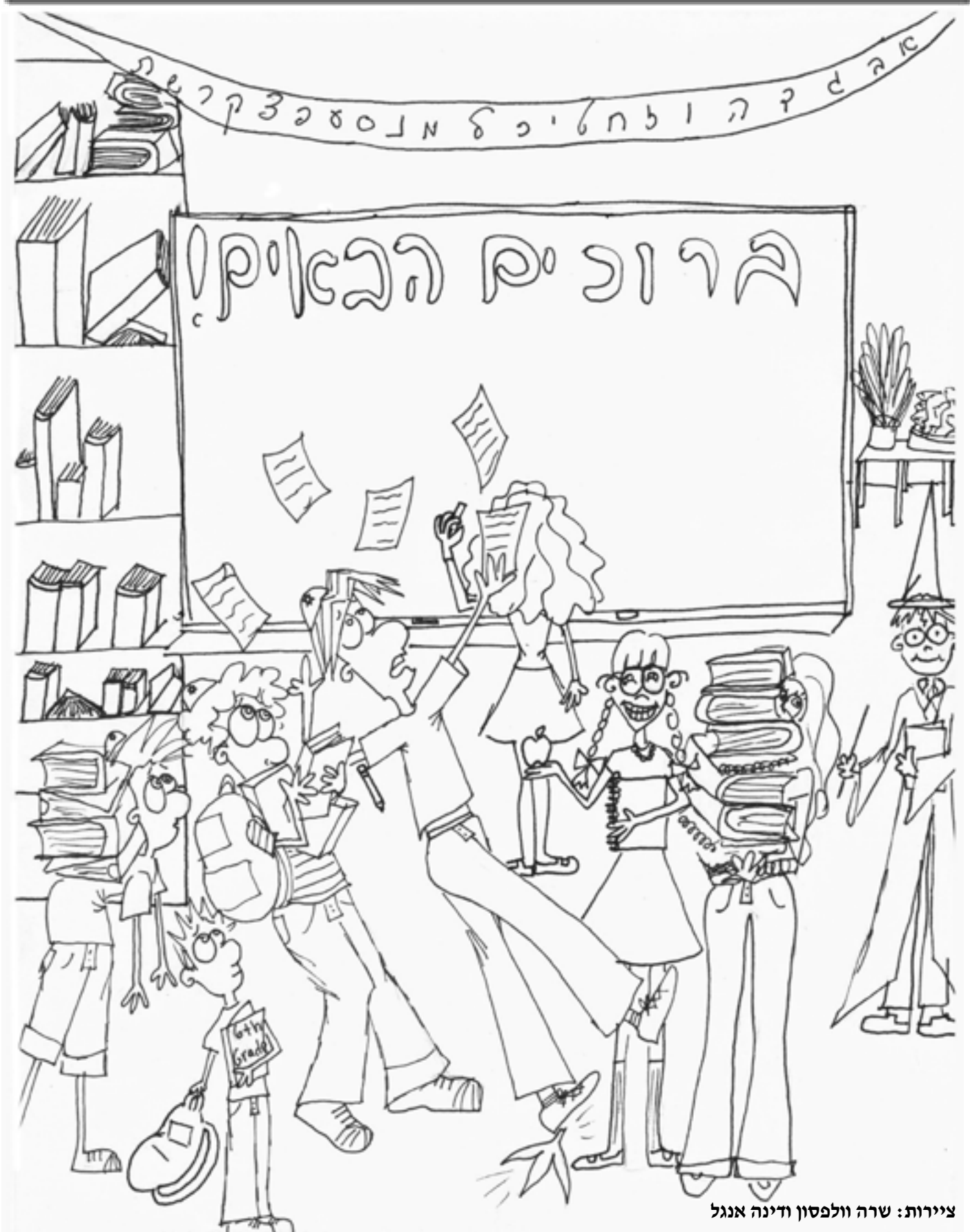
ציירות: שרה וולפסון ודינה אנגל